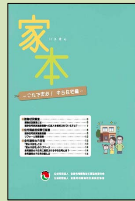
別冊 — これで安心！中古住宅編 —

【発行者】 公益社団法人 全国宅地建物取引業協会連合会 公益社団法人 全国宅地建物取引業保証協会