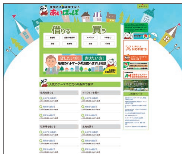
「あいぽっぽ」のトップ画面

をワンストップで見ることができます。2020年4月には新しい流通サイト「あいぽっぽ」をオープンし、このサイトに物件を登録すれば自社の物件管理ができるだけでなく、レインズやハトマークサイト、その他の有料サイトなどのポータルサイトにボタン一つで物件登録ができるようになりました。愛知で最も使われるサイトを目指そうと考えて設計しましたので、会員は朝出社したらまず「会員マイページ」を開き、新規登録物件をチェックしたりニュースを確認するような感じで利用してもらえたらと思っています。そして、多くの会員が利用すれば、SEO対策にもなります。さらに