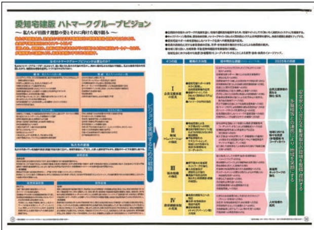
愛知宅建版ハトマークグループビジョン