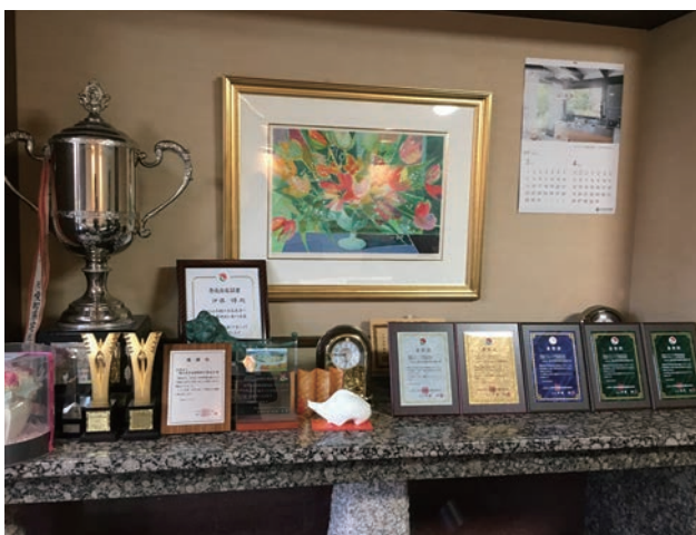
キャリアパーソン受講推進協会等表彰状の数々

当協会でも事務局職員の欠員を募集することがあります。ただ応募はたくさん来ますが、協会の将来を託せるような人はあまりいません。企業の場合と同様、協会でも職員を育てるには相当な投資と時間がかかります。職員は組織を存続させていくための最も大事な財産で、組織の宝だと思