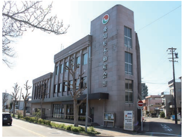
空き家相談窓口がある愛知県不動産協会

空き家マイスターになるには先ほどの資格以外に、初年度登録料1万円と、登録更新料が毎年1万円かかりますが、空き家の情報を優先的に得