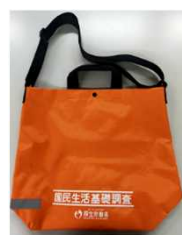
調査員が持ち歩く 手さげ袋（見本）