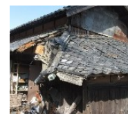
緊急代執行を要する 崩落しかけた屋根