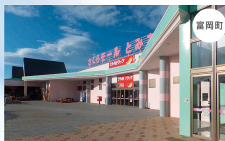
さくらモールとみおか