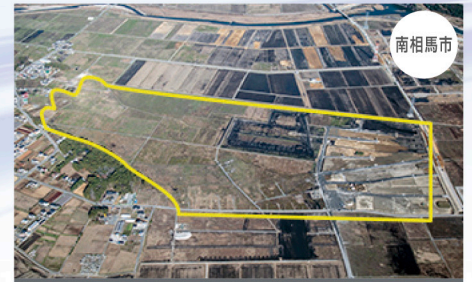
南相馬市復興工業団地