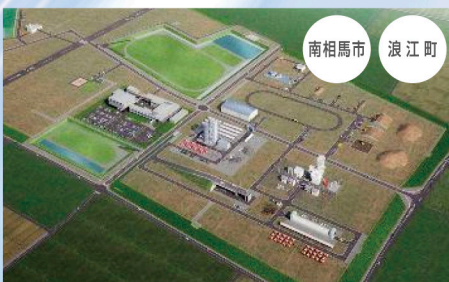
福島ロボットテストフィールド