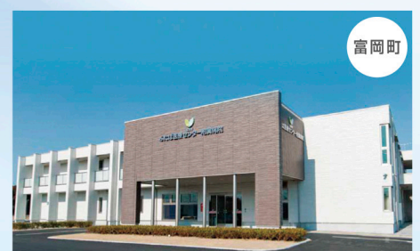
ふたば医療センター附属病院