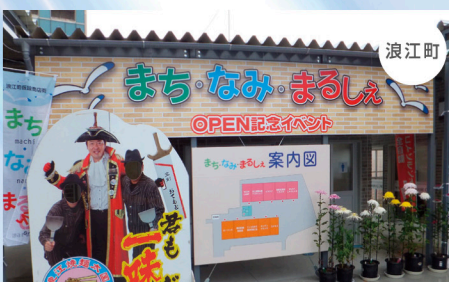
まち・なみ・まるしえ