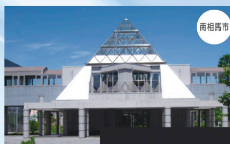
テクノアカデミー浜