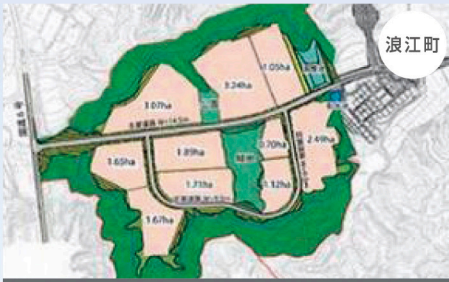
浪江町南産業団地