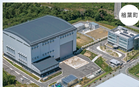
楡葉遠隔技術開発センター