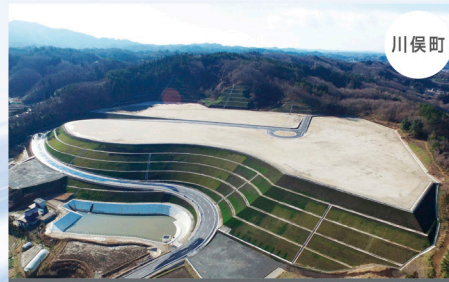
川俣西部工業団地