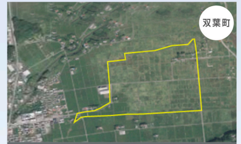
双葉町中野地区復興産業拠点