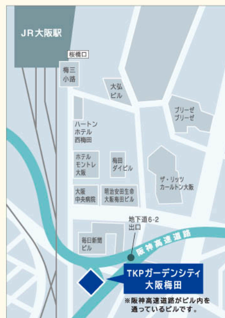
〈TKPガーデンシティ大阪梅田周辺MAP〉 JR大阪駅から徒歩8分

(主催) 一般財団法人福島イノベーション・コースト構想推進機構、福島県 (共催) 経済産業省 (後援(予定)) いわき市、相馬市、田村市、南相馬市、川俣町、広野町、楡葉町、富岡町、川内村、大熊町、双葉町、浪江町、葛尾村、新地町、飯館村、公益社団法人福島相双復興推進機構、独立行政法人中小企業基盤整備機構近畿本部、公益社団法人関西経済連合会、大阪府商工会議所連合会、大阪商工会議所、大阪府商工会連合会、株式会社東邦銀行、NPO法人ロボットビジネス支援機構