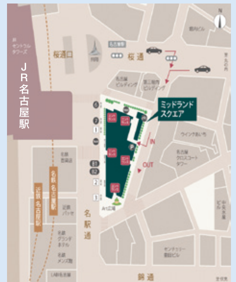
〈ミッドランドスクエア周辺MAP〉 JR名古屋駅から徒歩5分

(主催)一般財団法人福島イノベーション・コースト構想推進機構、福島県 (共催)経済産業省 (後援(予定))いわき市、相馬市、田村市、南相馬市、川俣町、広野町、楡葉町、富岡町、川内村、大熊町、双葉町、浪江町、葛尾村、新地町、飯館村、公益社団法人福島相双復興推進機構、一般社団法人中部経済連合会、愛知県商工会議所連合会、名古屋商工会議所、愛知県商工会連合会、株式会社東邦銀行